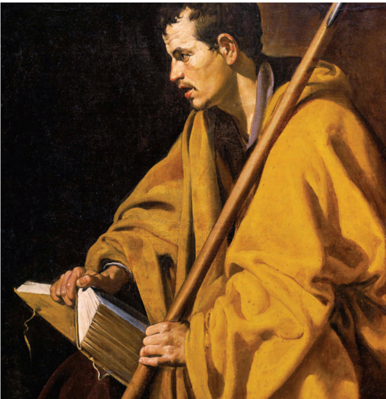
Diego Velázquez, Santo Tomás (1619), Museo de Bellas Artes, Orleans.

Ésta es, por tanto, la perspectiva con la que leeremos el texto: al recorrer El sentido religioso y confrontarnos con él, podremos verificar si la experiencia que hemos hecho en estos años ha conseguido incidir en nuestra vida o, en otros términos, «en qué es útil Cristo para el camino que el hombre hace en su relación con las cosas, para el camino hacia su destino. Porque, en caso contrario, si no tuviera influencia como una presencia real, Cristo sería algo que no tiene nada que ver con la vida, que no tendría nada que ver con la vida. Tendría que ver con la vida futura, pero no con esta vida: es justamente la postura del protestantismo» 5 . Si Cristo está presente, no es porque nosotros lo digamos, sino porque Le podemos reconocer a través de los signos. «Está porque actúa» 6 , ésta es la regla que siempre hemos escuchado. Puedo descubrir que Cristo está presente por los signos de despertar humano que veo en mí y en los demás. Su presencia es tan objetiva como los signos que la documentan.