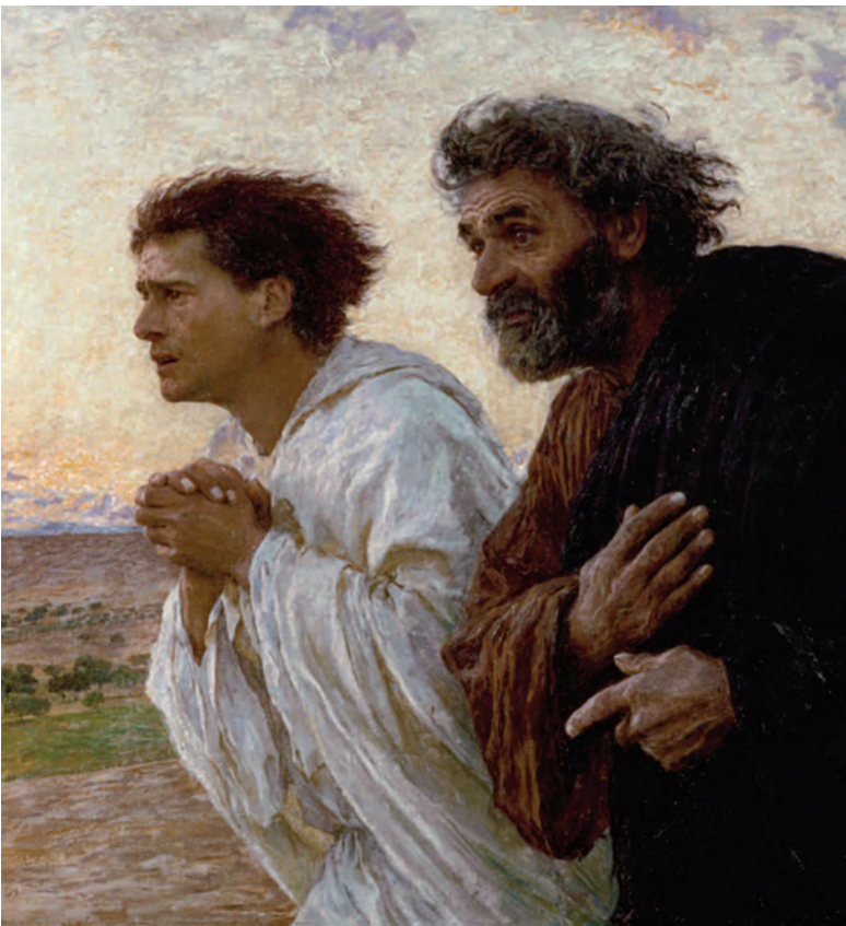
Eugène Burnand, Pedro y Juan corren al sepulcro (1898), Museo d'Orsay, París.

humano en todas sus dimensiones fundamentales—, entonces el cristianismo se revelará como algo creíble y su pretensión se podrá verificar. «Cada árbol se conoce por su fruto» 24 ; éste es el formidable criterio epistemológico que el mismo Jesús nos ofrece. El cambio generado por la relación con Cristo presente es tal que san Pablo no duda en exclamar: «El que está en Cristo es una criatura nueva. Lo antiguo ha pasado, lo nuevo ha comenzado» 25 . La criatura nueva es el hombre en el que el sentido religioso se realiza en su plenitud —una plenitud de otro modo imposible—: razón, libertad, afecto y deseo.