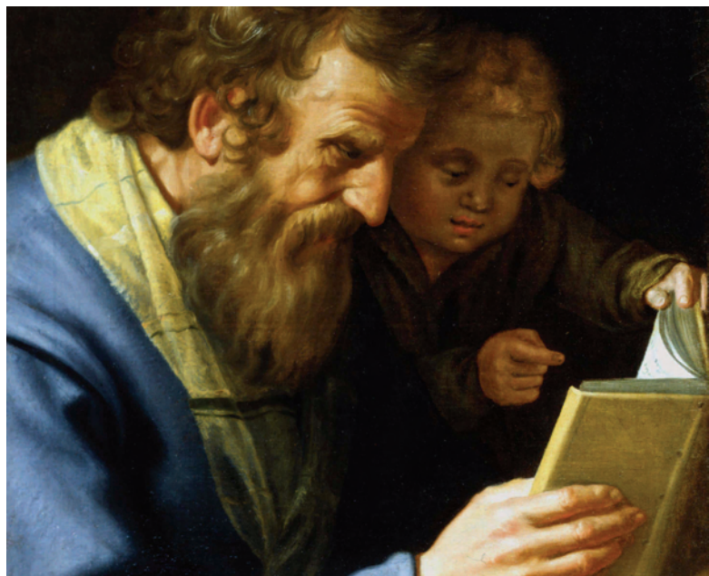
Abraham Bloemaert, San Mateo y el ángel (1621).

Nosotros podemos ser cómplices de esta influencia del poder si pensamos con presunción que podemos arreglárnoslas solos, sin seguir con inteligencia y afecto ese único punto que nos ha dado el Misterio para arrancarnos de la nada. La confusión puede ser tan profunda incluso entre nosotros que, cuando tratamos de indicar una solución a la situación en la que vivimos, nos sorprendemos repitiendo las mismas